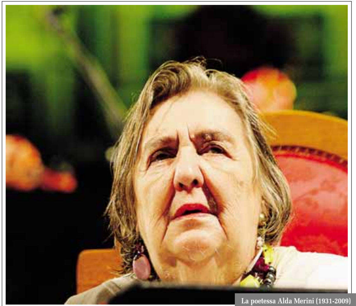
La poetessa Alda Merini (1931-2009)