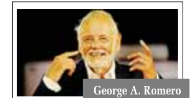
George A. Romero